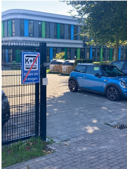
Personeelsingang Jac. van Vollenhovenstraat

Leerlingen die met de auto worden gebracht, worden vaak bij de personeelsingang aan de Jac. van Vollenhovenstraat afgezet. Graag willen wij u, in verband met de veiligheid, verzoeken om uw kinderen af te zetten bij de fietsenstalling aan de Gershwinstraat. Bedankt voor uw medewerking.