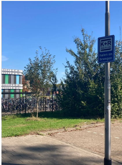
Fietsenstalling aan de Gershwinstraat