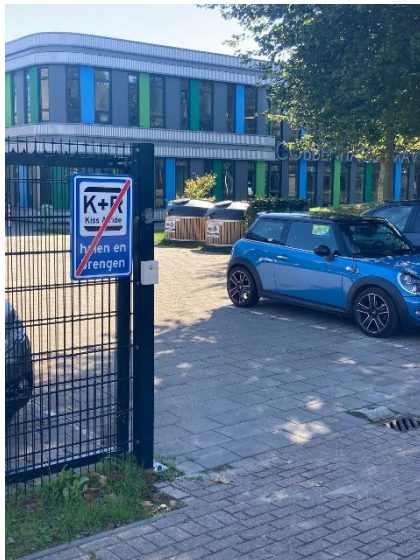
Personeelsingang Jac. van Vollenhovenstraat

Leerlingen die met de auto worden gebracht, worden vaak bij de personeelsingang aan de Jac. van Vollenhovenstraat afgezet. Graag willen wij u, in verband met de veiligheid, verzoeken om uw kinderen af te zetten bij de fietsenstalling aan de Gershwinstraat. Bedankt voor uw medewerking.