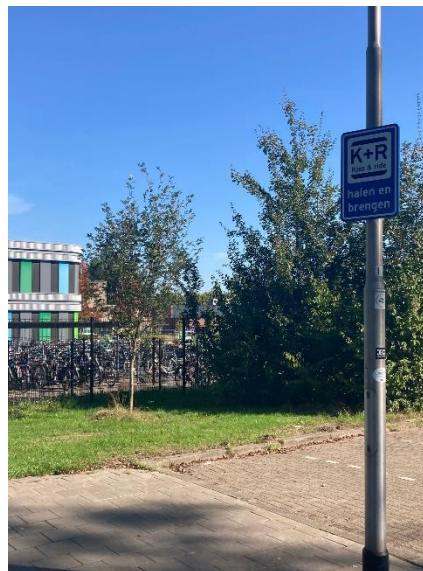
Fietsenstalling aan de Gershwinstraat