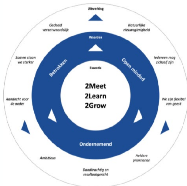
Figuur 2. Merkkompas 2College

De interactie tussen leerlingen en docenten gebeurt op onze vestigingen. Daar moet de identiteit en de ambitie worden waargemaakt. Iedere vestiging heeft een eigen invulling van de onderwijskundige principes (18 thema's) die optimaal aansluit bij haar leerlingen, onderwijs en situatie en heeft dit vastgelegd in een vestigingsplan. Waarbij hoofdstuk 1 gaat over de identiteit van de vestigingen, hoofdstuk 2 over de invulling van de onderwijskundige principes en hoofdstuk 3 over de activiteiten.