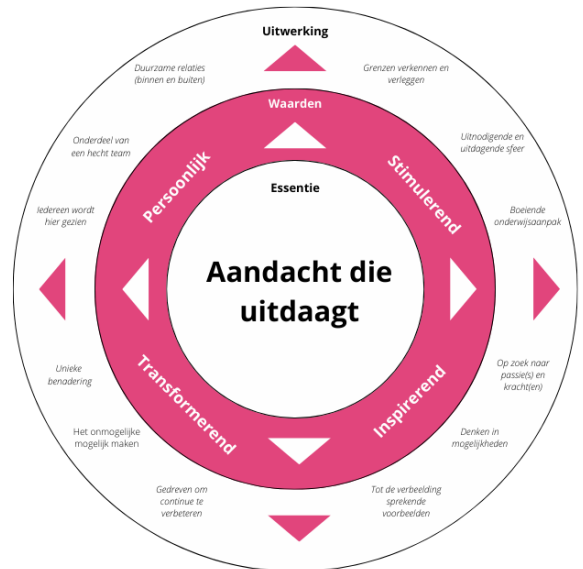
Figuur 3. Merkkompas 2College Jozefmavo

De mooie en persoonlijke resultaten die we halen spreken tot de verbeelding. Met onze manier van onderwijs inspireren wij elkaar en onze omgeving.